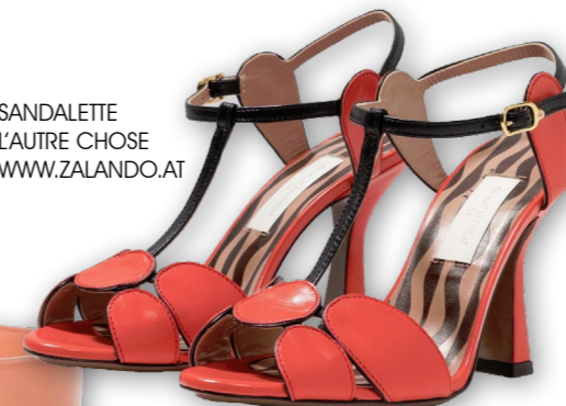
SANDALETTE L'AUTRE CHOSE WWW.ZALANDO.AT