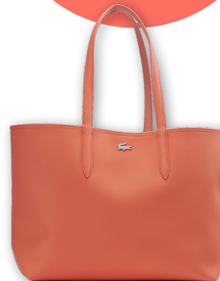
LACOSTE BAG WWW.ZALANDO.AT

Living Coral, die Farbe des Jahres 2019: ein anregendes, warmes und lebensbejahendes Orange mit goldenem Unterton. Diese Farbe schmeichelt jedem Haar- und Hauttyp. Wer es kontrastreich mag, kombiniert Living Coral mit der Komplementärfarbe Blau.