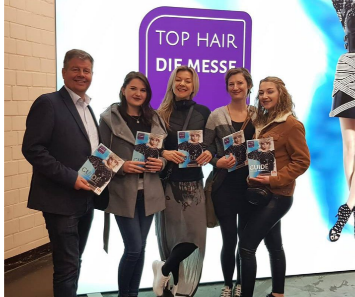
TOP HAIR DÜSSELDORF