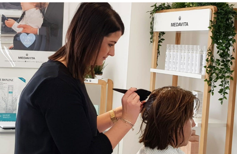
MEDAVITA SCHULUNG MAILAND