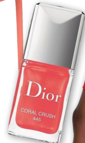
NAGELLACK CORAL CRUSH, DIOR