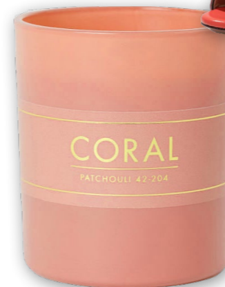
DUFTKERZE H&M HOME