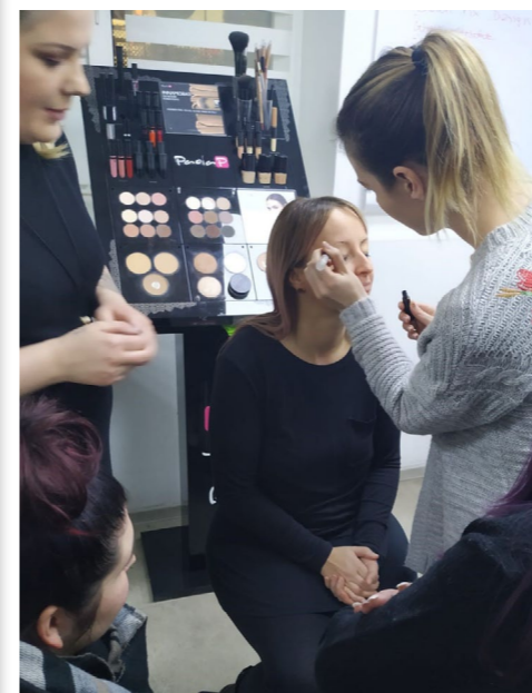
PAOLA P-MAKE-UP SCHULUNG