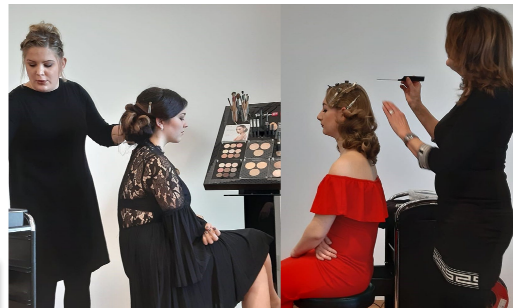
LONGHAIR CREATIVE SEMINAR