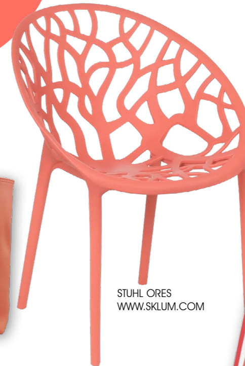
STUHL ORES WWW.SKUM.COM