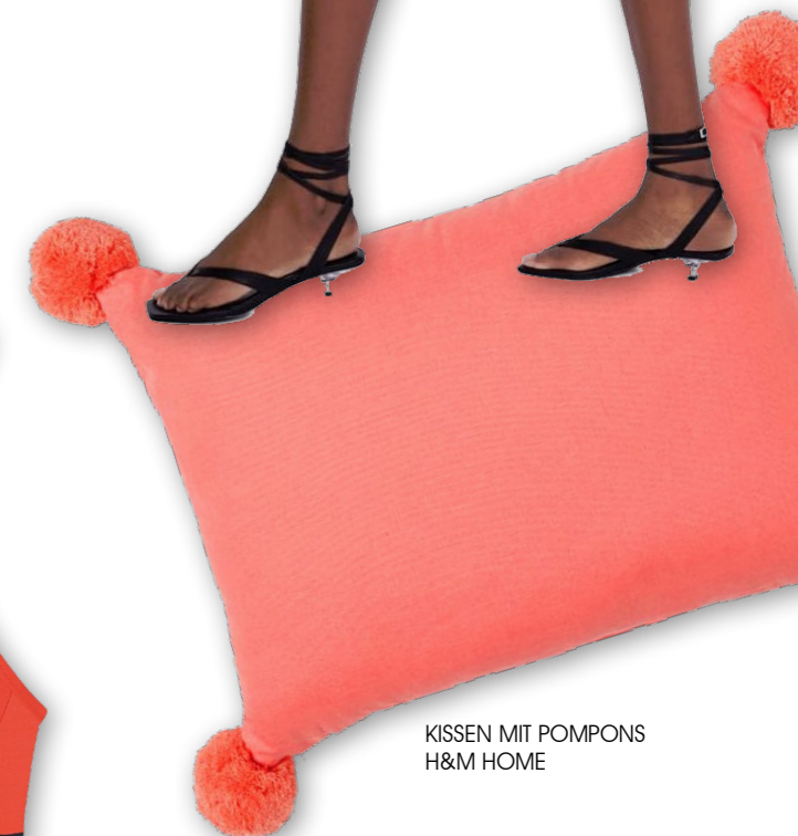
KISSEN MIT POMPONS H&M HOME