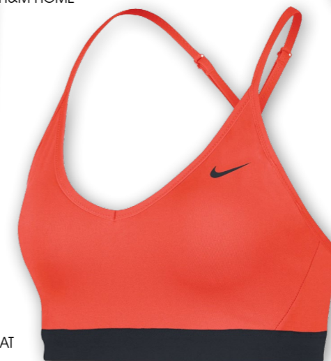
NIKE INDY BRA WWW.ABOUTYOU.AT